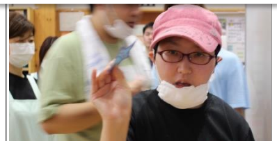
↑お願いを書いたよー