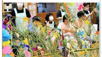
↑きれいに飾れたよー