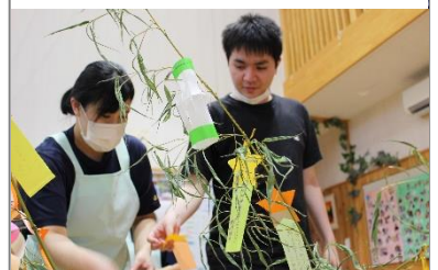
↑短冊をつけたよー