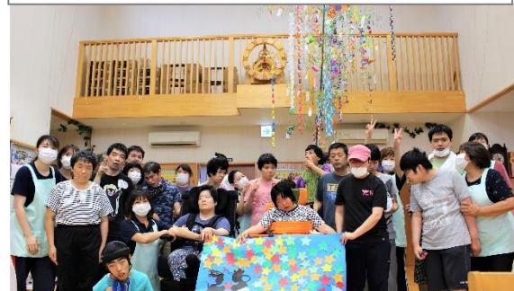
7/7 七夕にちなんだレクリエーションをしました。大地の中にあるたくさんの星を集めるレクリエーションです。みんなで天の川を作りました。晴れるといいね。