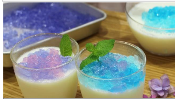
6/26 完成したあじさいゼリーです。とてもおいしいゼリーで、しかもきれいです。カレンダープロジェクトで撮影しちゃいました。カレンダーお楽しみに！