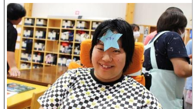
↑私がスターデーす