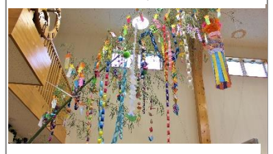
↑立派な七夕飾りでーす