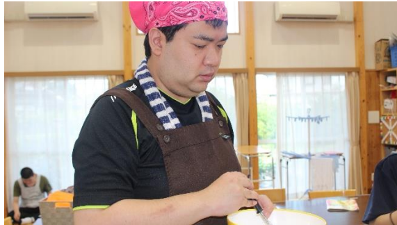
6/26 手作りおやつづくりで「あじさいゼリー」を作ります。男の子でもおやつづくり大好きです。だって、パティエはほとんど男性でしょ。ボクだってできます。

ご利用者の気持ちの寄り添った支援をする。ご家族から感謝の言葉が届く。「やったあ」と心の中で叫ぶ。そこに「働きがい」が見つかるといいですね。