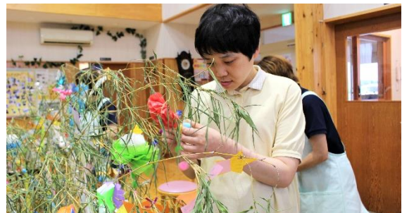
7/6 今年の願いを書いた短冊と飾りをみんなで作り、七夕飾りをします。自分の短冊をつけるのと、飾りをきれいに飾るのは楽しいです。