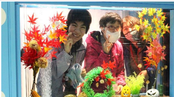
10/17 秋のイベント さいたま水族館に出かけました。水槽越しの記念撮影スポットでは、魚の世界にいるみたいです。