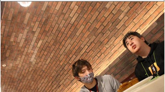
11/7 本格イタリアンレストランにランチを食べに行きました。室内は高級感あふれるレンガのアーチ作りです。ワクワクドキドキのランチの始まりです。