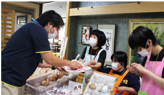
10/7 ふぁみいゆ東館での販売会 コロナウイルス感染症の予防対策でしばらく屋外での販売でしたが、ようやく館内での販売が復活。うれしい！