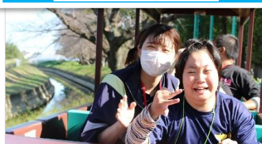
↑話題の無限列車に乗車中！