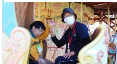
↑メリーゴーランドの妖精たち