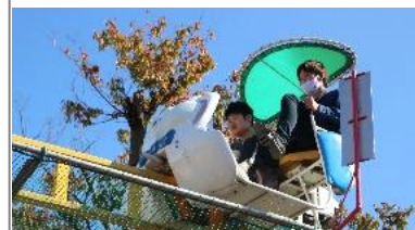
↑空高くサイクリング