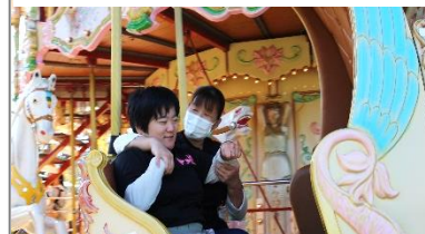
↑メリーゴーランドでダンス