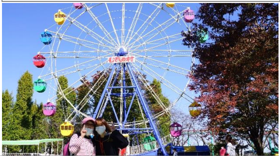
10/31 秋のイベント むさしの村満喫ツアー すばらしい晴天。むさしの村のたくさんの乗り物に乗りました。観覧車もジェットコースターも楽しかったです。