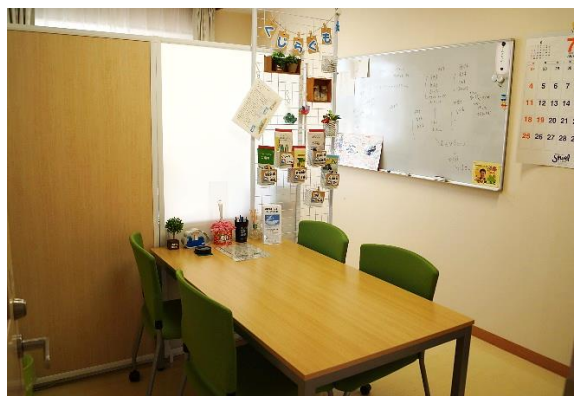
相談支援センターでこれからの考えます。