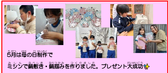
5月は母の日制作で