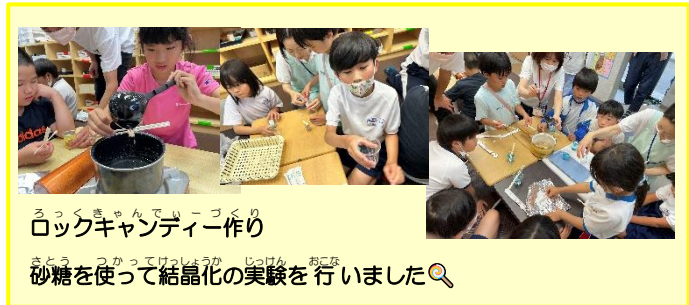
ロックキャンディー作り