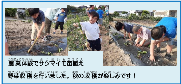
農業体験でサツマイモ苗植え

子どもたちの中にもそれぞれ役割があります。時間にルーズだけど、タイムキーパーでみんなに片付けや帰る時間をお知らせしてくれる子。初対面の人にもどんだん話に行く、にじいろプラス宣伝部長の子。ひと距離感が近い時もあるけど、みんなに安心感を届けてくれる子。発達の凸凹があっても、それぞれのこだわりや少し困ってしまうことも、それをよく捉えることで、にじいろプラスの中で役割として非常に助かっています。そこには子ども達が生き生きと過ごせる環境づくりや人と人との良い関係性が、その子の良いところを更に輝かせているのではないかと感じています。