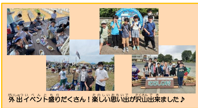
外出イベント盛りだくさん！楽しい思い出が沢山出来ました♪