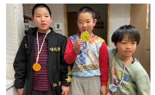
こま回し最強決定戦の上位3名です！