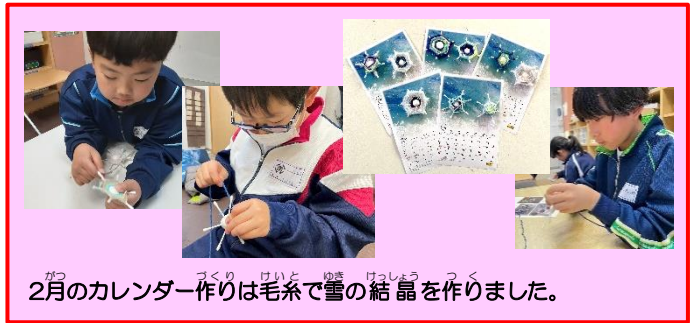
2月のカレンダー作りは毛糸で雪の結晶を作りました。