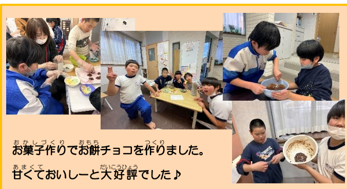
お菓子作りでお餅チョコを作りました。