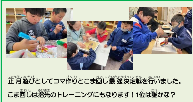
正月遊びとしてコマ作りとこま回し最強決定戦を行いました。