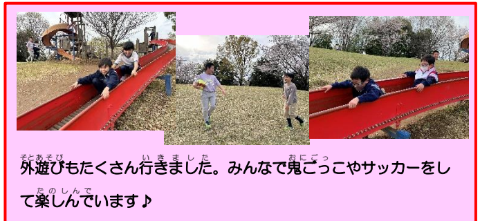
外遊びもたくさん行きました。みんなで鬼ごっこやサッカーをして楽しんでます♪