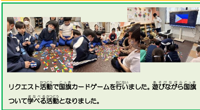
リクエスト活動で国旗カードゲームを行いました。遊びながら国旗について学べる活動となりました。