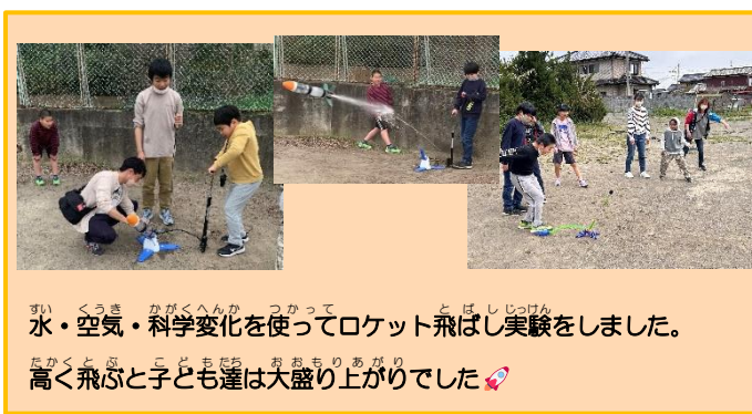
水・空気・科学変化を使ってロケット飛ばし実験をしました。高く飛ぶと子ども達は大喜び上がりでした🚀