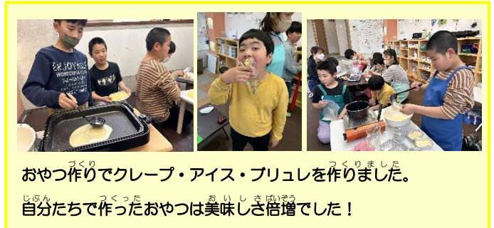
おやつ作りでクレープ・アイス・プリュレを作りました。自分たちで作ったおやつは美味しさ倍増でした！